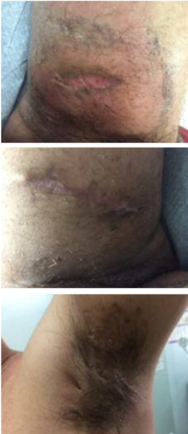
Figura 2. Registo fotográfico das lesões.

diagnóstico de hidradenite supurativa Hurley III.