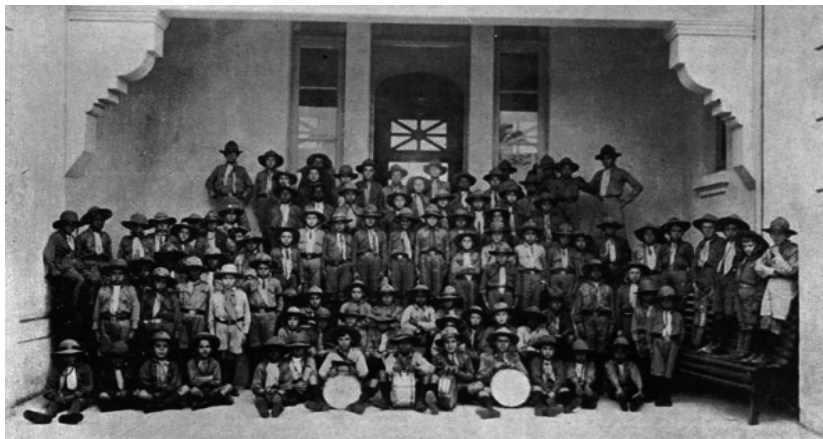
Figura 1 – Grupo de Escoteiros Municipais

Nas primeiras fileiras, alguns dos meninos sentados no chão seguram tambores. Os alunos das fileiras laterais aparecem sentados ou em pé, nos bancos de madeira colocados dos dois lados. Os meninos são, em sua maioria, brancos, porém, verifica-se a presença de alguns negros. No binômio apresentado por Carvalho (1998): educação para o povo e educação para as elites, o ensino primário era aquele que abarcava as camadas populares. Segundo Augusto Simões Lopes, no Relatório Intendencial de 1927: