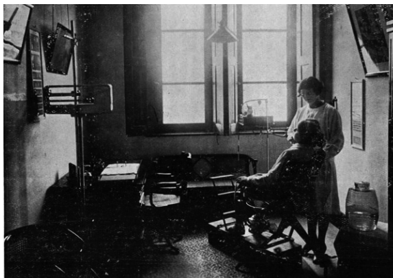
Figura 2 – Gabinete Dentário Ambulante