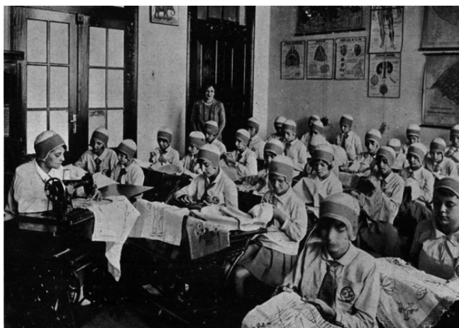
Figura 4 - Uma aula de trabalhos manuais

Deve-se desconfiar dessa fotografia, do seu caráter de imagem posada, caráter presente em praticamente todas as imagens do conjunto. As alunas uniformizadas, concentradas em seu trabalho, enquanto, ao fundo, uma professora vestida elegantemente (o que pode ser percebido através dos adereços por ela utilizados, como o seu colar, e pelas suas roupas, semelhantes às de mulheres que eram retratadas para revistas da sociedade pelotense , da época) as observa. Além da professora, uma aluna uniformizada destaca-se, sentada diante de uma mesa na qual se encontrava a máquina de costurar. Essa aluna provavelmente fosse uma monitora, ou alguém de uma série mais adiantada. A fotografia foi tirada de um ângulo que permite quase que o total enquadramento das alunas. Ao redor, nas paredes da sala, mapas geográficos e pôsteres com explicações de ciências, signos da modernidade pedagógica. Modernidade que, possibilitada pela legenda do Relatório Intendencial, estaria presente em todas as escolas municipais.