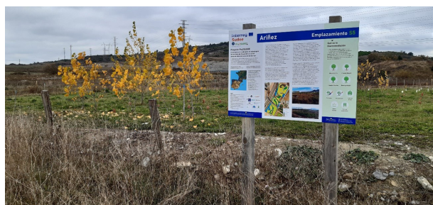
Figura 2 - Zona de fitorremediación con chopo incluida en el corredor verde Mendebaldea.

El ámbito se zonifica como sigue: las zonas contaminadas se sanean y se establecen como parcelas a fitorremediar, aquellas con acopios de inertes (áridos, tierras) se remodelan reutilizando los materiales para crear nueva topografía (diques de tierra como barrera acústica), los suelos pobres reciben enmiendas orgánicas y los suelos en mejor estado se reservan para los usos agrícolas. Las escorrentías se retienen en superficie mediante la creación de charcas temporales (Figura 2).