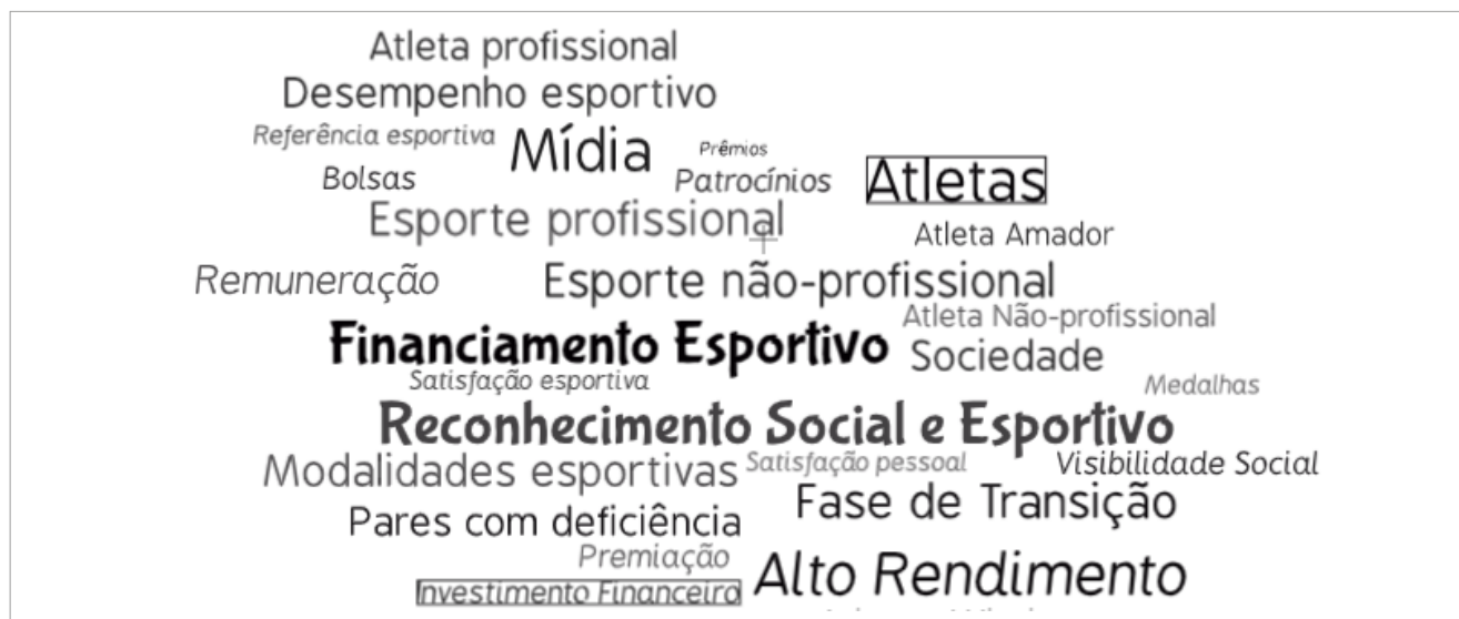
Figura 2. Nuvem com as palavras geradas a partir dos eixos temáticos mais latentes nos documentos orais analisados.