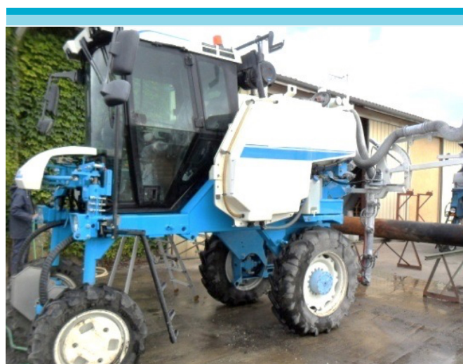
Figura 1: Tractor.

En lo que concierne al material agrícola, los tres viñedos cuentan con uno o dos tractores con cabina climatizada y un tanque en cada lado. En el viñado 1, la mezcla se realiza en un reservorio, en el viñado 2, en una cisterna, en el viñado 3, en un incorporador.