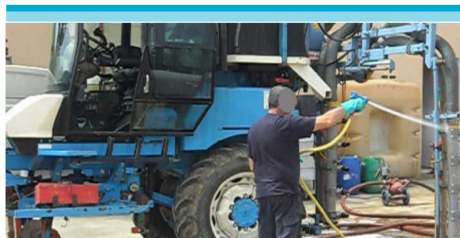
Figura 3: Limpieza del tractor luego de la aplicación.