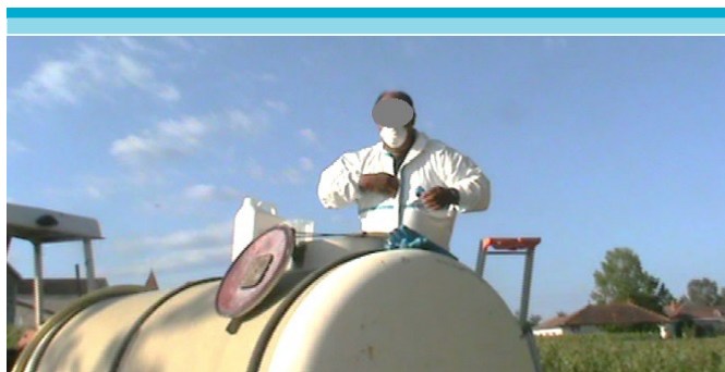
Figura 4: Contestando una llamada durante la preparación.

En cuanto a los viticultores del viñedo 2, su empleador les ha hablado de manera general, “hay que prestar atención, protegerse bien, utilizar la máscara, guantes, trajes de protección” . Sin embargo, esto resulta insuficiente. Pues, cuando los viticultores se quitan los guantes, no los enjuagan y no cierran bien su traje pudiendo entrar partículas a su cuerpo. En caso de recibir una llamada telefónica, el V2 se quita sus guantes contaminados para sacar el celular de su camisa.