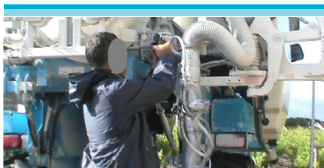
Figura 6: Retiro de filtros.

En el caso de V4, dado que recién se ha integrado a la empresa, sus dificultades en la utilización de los materiales agrícolas son visibles a pesar de sus intenciones de protegerse. Por ejemplo, no puede retirar fácilmente las piezas pequeñas (ej. filtros), debiendo intentar varias veces y sacarse sus guantes entrando en contacto con el agua contaminada.