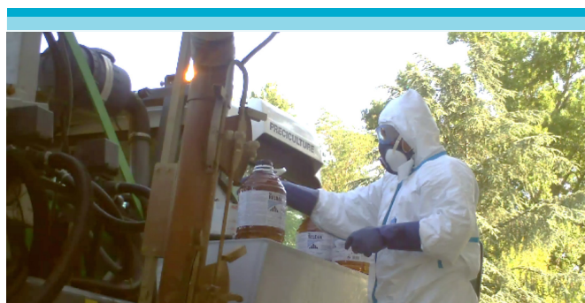
Figura 5: Adición de pesticidas al pulverizador.

En este caso, la empresa a la cual él pertenece, ha ido adquiriendo mejores materiales agrícolas, por lo cual el trabajador considera que las condiciones son más óptimas, lo cual le permite realizar otras tareas, señalando que no puede limitarse a ocupar solo su puesto, pudiendo compensar la falta de personal.