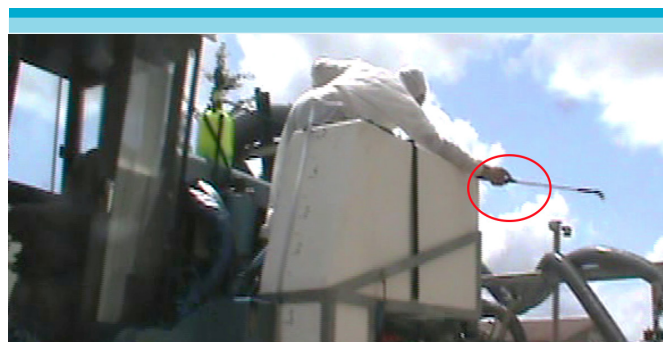
Figura 11: Echando agua comprimida a diferentes partes del tractor pulverizador.

Finalmente, una tarea importante que dura alrededor de 90 minutos, es la limpieza del tractor, el cual debe quedar “como nuevo” , realizado en el viñedo 2 de manera exhaustiva para prevenir fallas de esta maquinaria. Esto obliga a adoptar posturas forzadas y aumenta el riesgo de contacto con las piezas contaminadas. Durante esta tarea de limpieza, la utilización de los guantes es dejado de lado por dificultar la manipulación de piezas pequeñas. El V2 señala que no está seguro que la contaminación pueda darse por vía cutánea, según él, “estamos inmunizados, no arriesgamos nada (risas), yo no sé, tal vez (el pesticida puede penetrar)” . Contrariamente, su colega V3 está convencido que los pesticidas pueden atravesar la piel y llegar a la sangre, pero en su rutina, no utiliza los guantes.