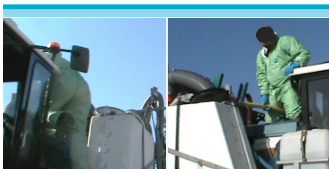
Figuras 9-10: Atravesando por arriba del tractor y agarrando la manguera durante el llenado del tanque.

En el caso del V3 al llenar los tanques de cada lado del pulverizador, los cuales deben estar a un mismo nivel, señala que debe entrar a la cabina del tractor para hacerlo avanzar y retroceder, lo cual implica sacarse el traje de protección. Sin embargo, él atraviesa por la parte superior del tractor, justificando que lo hace “en lugar de bajar, sacarme los guantes (lavarlos), ponerme al volante” . El trabajador prefiere ignorar estas medidas porque lo que hace “es más rápido” , luego debe aplicar la mezcla a los cultivos por varias horas.