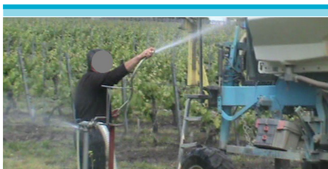
Figura 8: Parada al borde del campo.

Además, el V1 es el único que realiza paradas de su tractor durante la aplicación de la mezcla a las plantas. En una oportunidad, salió de su cabina para constatar si la boquilla de un tubo estaba atorada, sin embargo, no utilizó guantes, señalando que se olvidó, entrando en contacto directo con la nube vaporizada con pesticida. Luego, detiene su tractor en la periferia del terreno en tres momentos, para lavar la luna de su cabina y enjuagar otras piezas. En estas situaciones, él considera que ponerse los EPI sólo para echar un chorro de agua es una pérdida de tiempo ya que aún le queda 4 a 5 horas para terminar sus tareas.