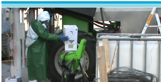
Figura 12: Adicionado los pesticidas a un incorporador.