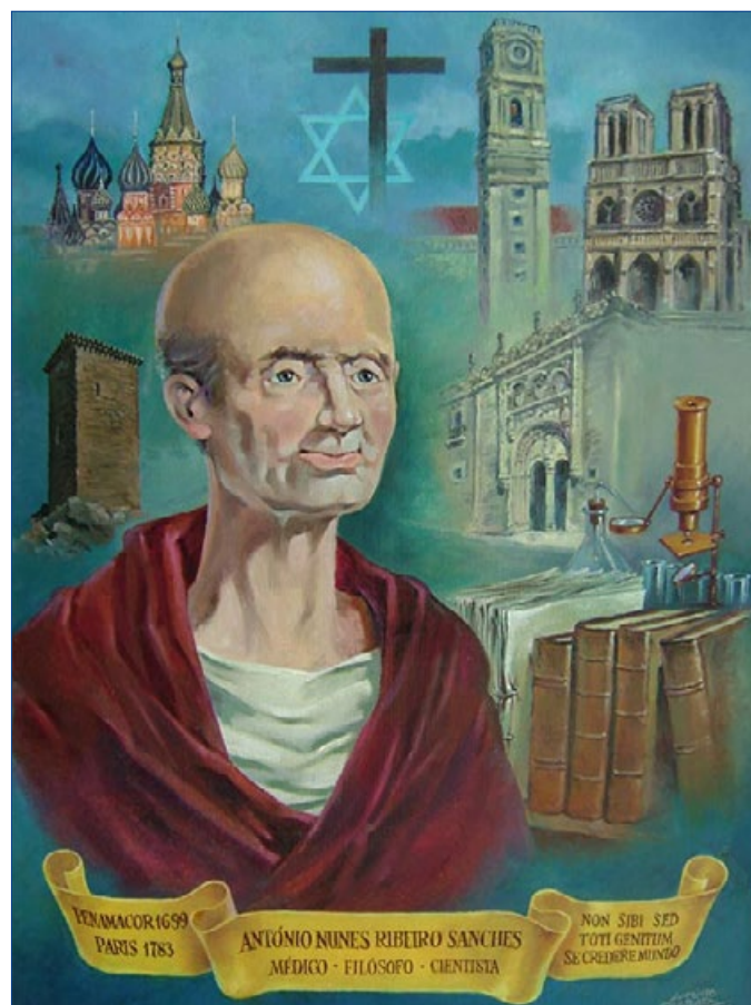
Figura 1 Tratado de Conservação da Saúde dos Povos , de António Nunes Ribeiro Sanches, médico, filósofo, pedagogo e historiador (1699-1783).